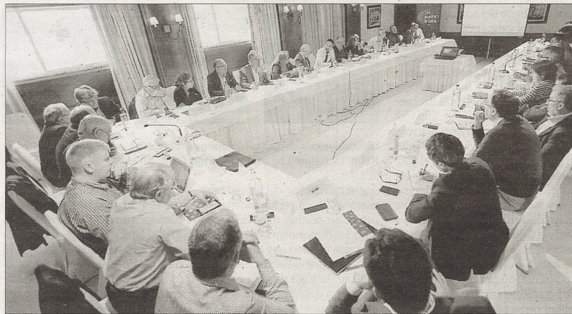
Imagen de los asistentes a la segunda jornada del Foro Económico de Galicia, ayer, en A Toxa.

Portugal como una oportunidad para el sector y no como una amenaza, pese a las últimas deslocalizaciones de producción hacia esa zona. "La euroregión en su conjunto tiene un enorme potencial dentro del sector, ambas regiones pueden ser complementarias, especialmente en capacidades y conocimiento, ya que determinadas tecnologías ligadas a las actividades del sector se dominan en una región y otras en la otra", explicó. Esta combinación ofrece, a su juicio, "innumerables" posibilidades para constituirse como "polo de atracción para nuevas empresas del sector o para nuevas actividades de